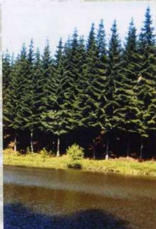
Futaie régulière résineuse

Dans les jeunes peuplements, la taille et l'élagage artificiel d'arbres d'avenir améliorent la qualité future du bois de sciage.