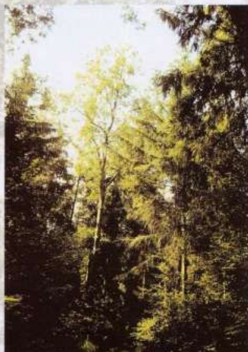
Etagement des âges