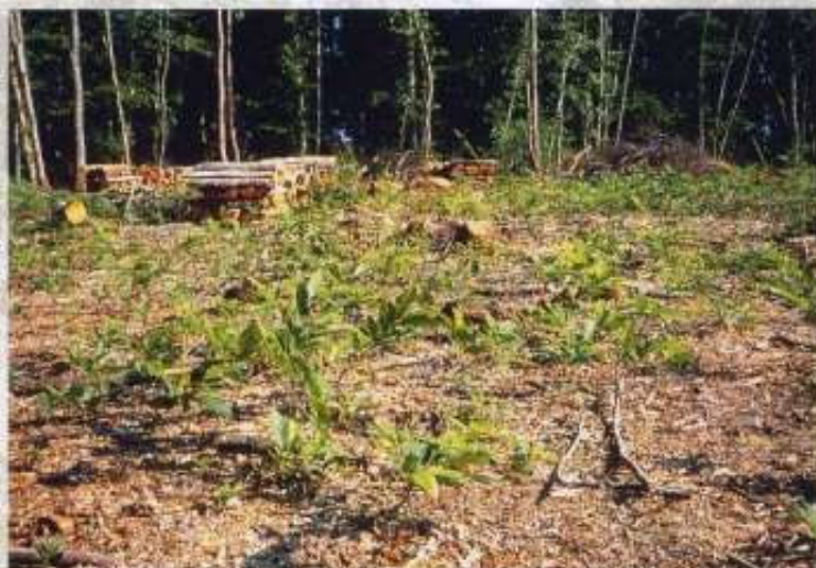
Taillis exploité : le recépage

En taillis dit "simple", la coupe rase ou recépage intégral du peuplement, intervient en général tous les 20-25 ans (en hiver, à ras du sol). Cette sylviculture permet la production uniquement de petits bois.