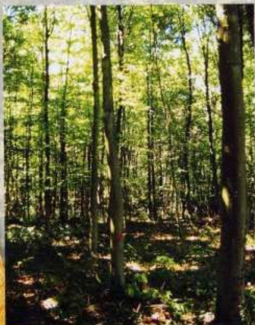
Futaie régulière feuillus

Pour en savoir plus contactez les techniciens de la forêt privée