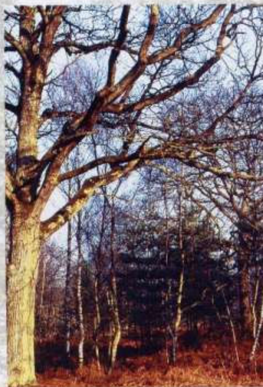
Chêne de TSF : Tronc court, houppier volumineux