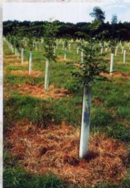
Maîtrise de la végétation et protection gibier

Le renouvellement des peuplements après coupe rase est obligatoire dans un délai de cinq ans lorsque la coupe est supérieure à un hectare dans un massif de plus de quatre hectares. Il doit être conforme aux dispositions suivantes :