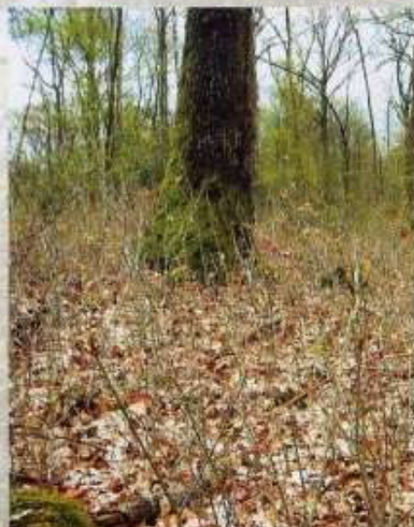
Régénération de chêne