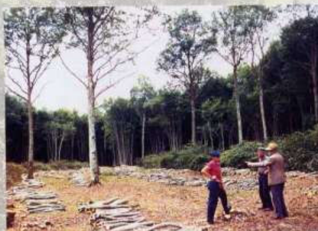
Coupe de TSF : Majorité de bois de feu